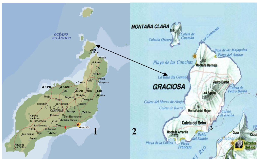
Figura 1: Mapas de Lanzarote (1) y La Graciosa (2).

Una muestra de su riqueza biológica lo constituyen, por ejemplo, las 304 especies de macroalgas que han sido catalogadas en esta zona, que representan el 53.15% de la vida marina total del Archipiélago Canario, y que la convierten en el área de mayor diversidad de dichas especies. Por otro lado, los recursos de sus aguas explican la abundancia de aves marinas de las que son la base de su nutrición. Es por esta razón por la que el área fue también declarada Zona Especial para la Protección de la Aves (ZEPA), un área, por definición, de gran sensibilidad ecológica. Entre las extrañas especies en peligro de extinción que se pueden encontrar en el Archipiélago Chinijo destacan especies de petreles, águilas marinas o el raro halcón de Eleonor.